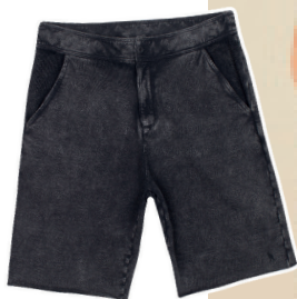
Bermuda moletom marmorizada curta