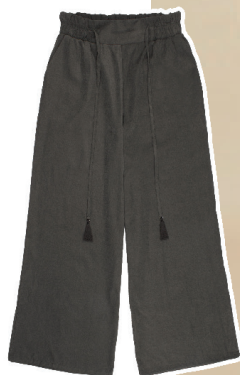
Calça pantalone tecido peletizado