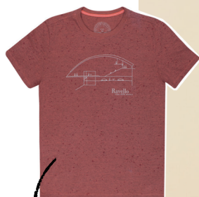
T-Shirt meia malha mescla tinturada Ravello