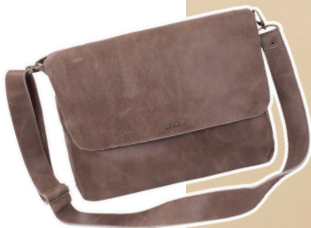
Pasta laptop couro raspa