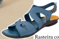
Rasteira comfort detalhe gota