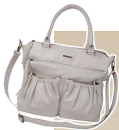
Bolsa média compartimentos