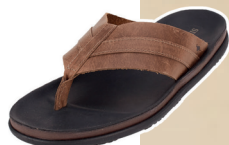
Chinelo de couro com palmeira anatômica