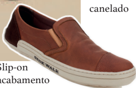
Tênis Slip-on couro com acabamento em óleo