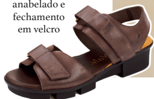
Papete com solado anabelado e fechamento em velcro