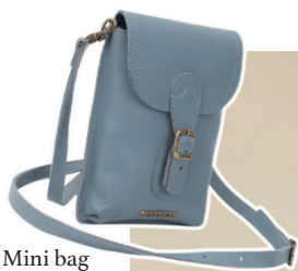
Mini bag color