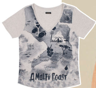
Camiseta visco linho Amalfi Coast apliques