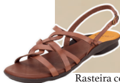
Rasteira comfort detalhe trança