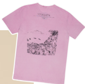
T-Shirt meia malha Sorrento