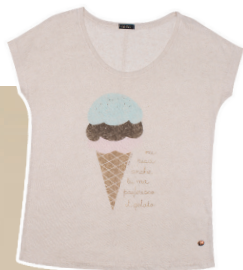
Camiseta visco linho Gelato