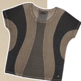
Camiseta recorte mix malhas