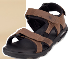
Papete com sistema de amortecimento no solado.