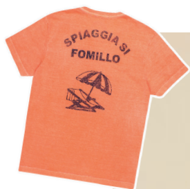
T-Shirt meia malha Spiaggia