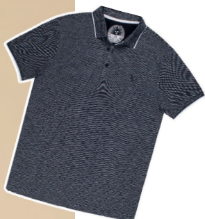
Polo piquet gola friso