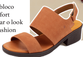
Salto bloco comfort Para deixar o look mais fashion