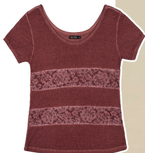
Camiseta visco crepe detalhe renda tinturada a seco