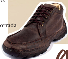
Bota mustang toda forrada em couro.