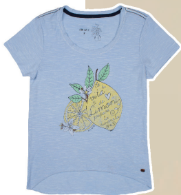
Camiseta flame Limoni