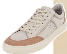
Tênis longo acabamento spray costuras