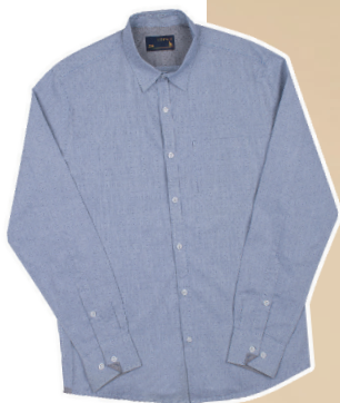
Camisa tricoline maquetada