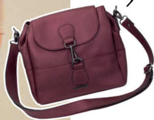
Bolsa vegana ferragens em níquel