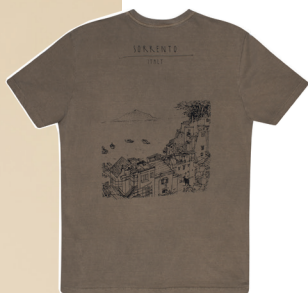
T-Shirt meia malha Sorrento