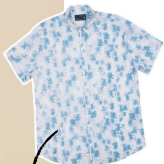
Camisa viscose coqueiros