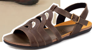
Sandália palmilha anatômica cabedal recortes