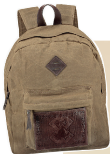
Mochila básica lona resinada