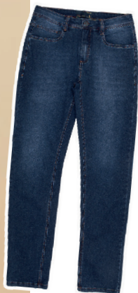
Calça jeans moletom