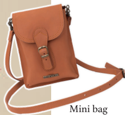
Mini bag color