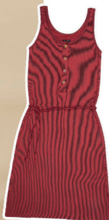
Vestido mid canelado