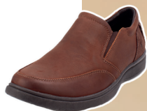
Casual Carbone solado leve e flexível com palmilha de memória