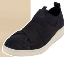
Tênis neopreme camurça resinada elásticos