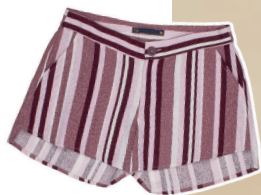
Shorts linho listrado