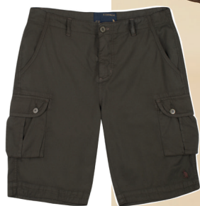
Bermuda cargo tecido leve texturizado.