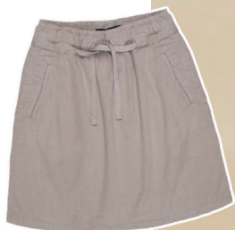
Saia viscose elástica